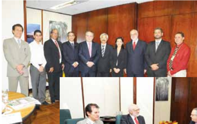
Diretoria do Ibrahort apresentou ao ministro seus objetivos

Atualmente as informações sobre o setor estão pulverizadas e não são suficientes para a elaboração de projetos futuros, uma vez que as fontes e