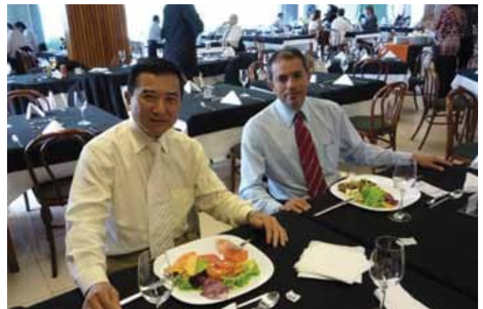
Coringa almoçou com o Deputado Junji Abe e pediu seu apoio para melhorias do setor