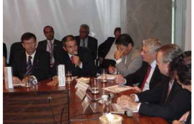
Em reunião com o Ministro da Agricultura, Coringa pediu a criação do PAC do abastecimento

Seguindo sua agenda Coringa presidiu a reunião da Câmara Setorial de Hortaliças,